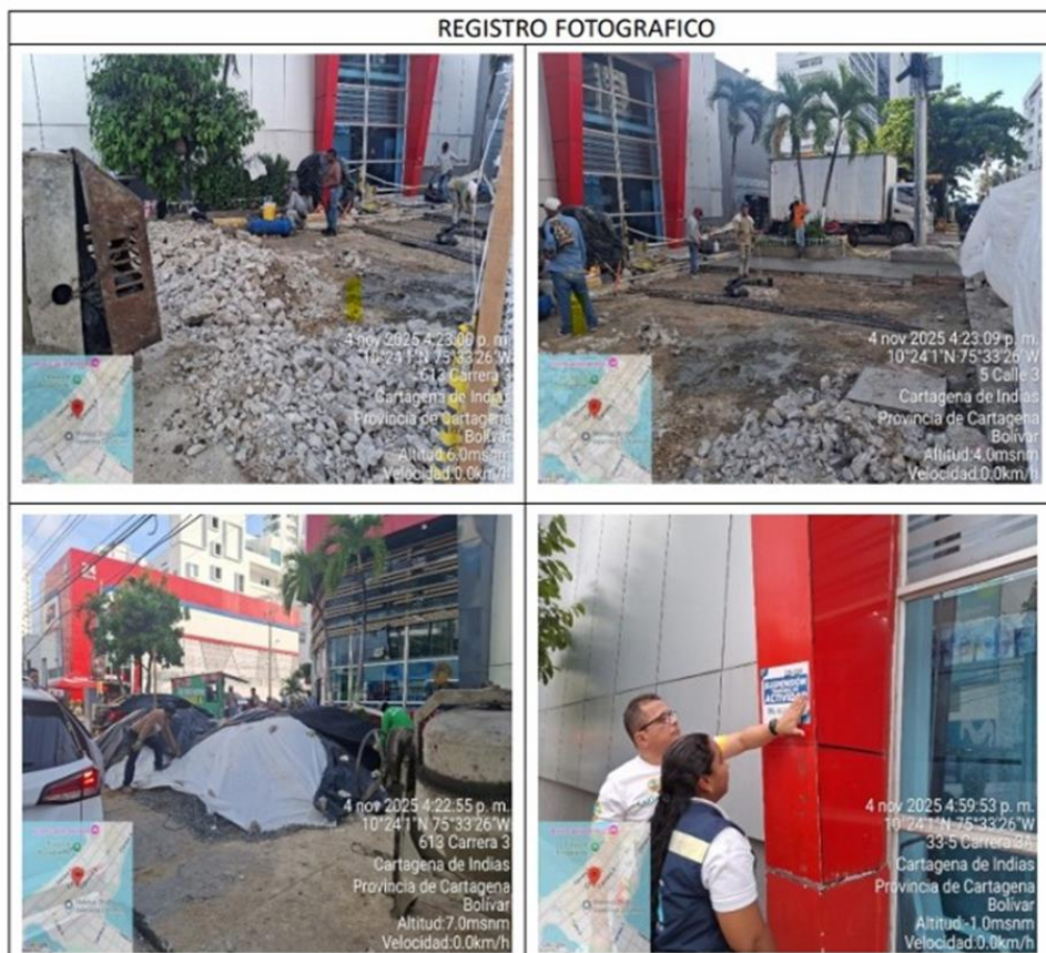
Ilustración 1: Realización de actividades generadoras de RCD.

Que teniendo en cuenta los hechos anteriormente descritos se generó la imposición de medida preventiva con suspensión de actividades, mediante acta No. 200-2025, y con numero de sello 200-2025.