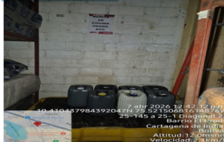
Figura 3: Almacenamiento temporal de ACU

Los aceites usados resultado de la operación de la cocina son almacenados en pimpinas plásticas ubicados cerca de la cocina los cuales se encuentran debidamente sellados, señalizados, cuentan con un kit antiderrames, estibas antiderrames, que permitan tomar acciones de contingencia en caso de derrames.