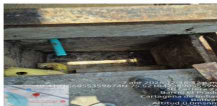
Figura 2: Trampa de Grasas

En general se evidencio que las trampas de grasa se encuentran en buen estado.