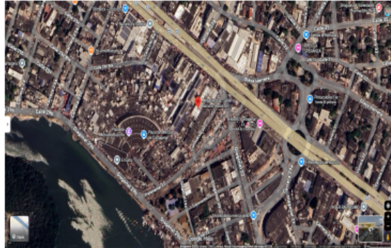
Figura 1: Localización del Restaurante Megatiendas