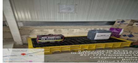
Figura 3: Almacenamiento temporal de ACU

El establecimiento cuenta con campana extractora en buen estado, le realiza mantenimiento semanal.