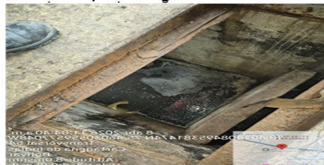
Figura 2: Trampa de Grasas

En general se evidencio que las trampas de grasa se encuentran en buen estado.