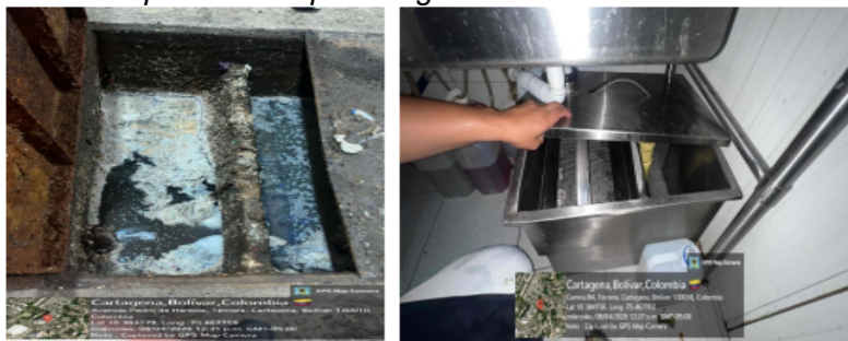
Figura 2: Trampa de Grasas

En general se evidencio que las trampas de grasa se encuentran en buen estado.