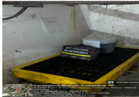
Figura 3: Almacenamiento temporal de ACU

Los aceites usados resultado de la operación de la cocina son almacenados en pimplinas plásticas ubicados cerca de la cocina los cuales se encuentran debidamente sellados, señalizados, cuentan con un kit antiderrames, estibas antiderrames, que permitan tomar acciones de contingencia en caso de derrames.