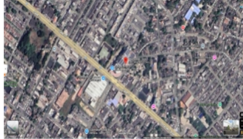
Figura 1: Localización del Restaurante Megatiendas

La visita fue atendida por JHOYNI CRESPO, en calidad de supervisora.