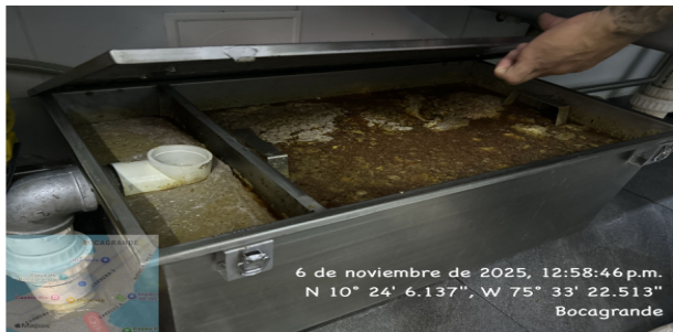
Figura 2: Trampa de Grasas

El establecimiento cuenta una trampa de grasa de acero ubicada deba del lavaplatos. Los lodos generados de esta trampa son dispuestos adecuadamente con una empresa autorizada para esta actividad, para su tratamiento y disposición final adecuada. En general se evidencio que las trampas de grasa se encuentran en buen estado.