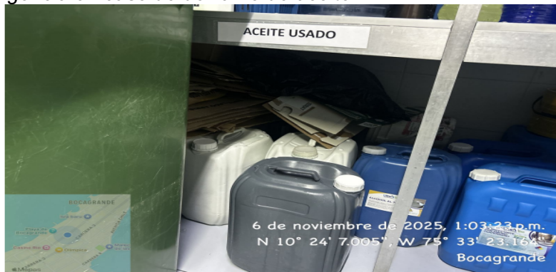
Figura 3: Almacenamiento temporal de ACU

Los aceites usados resultado de la operación de la cocina son almacenados en pimpinas plásticas ubicados en la cocina los cuales se encuentran debidamente sellados, señalizados. No cuentan con un kit antiderrames ni estibas antiderrames que permitan atender la contingencia en caso de derrame de aceite.