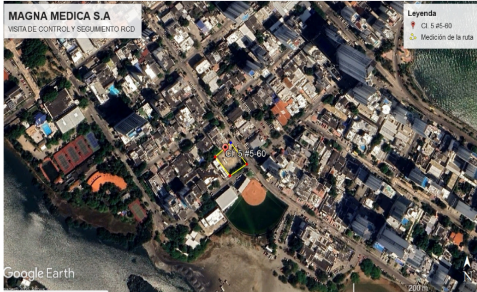
Ilustración 2: MAGNA MEDICA S.A.S.

En el momento en que se llega al sitio de la queja el vehículo de placas ELC119 no se encontró en el sitio de desarrollo del proyecto.