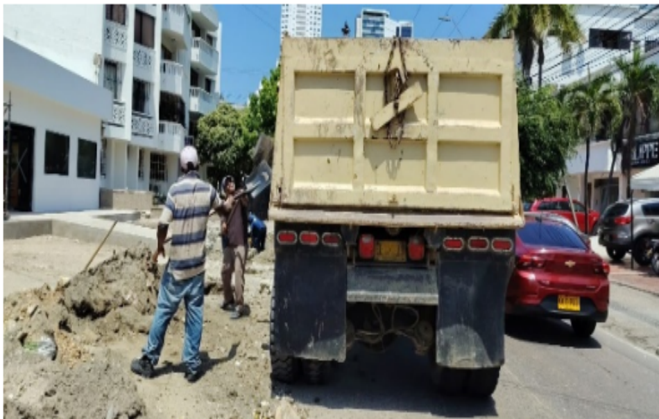
Ilustración 1: Vehículo placas ELC119 realizando cargue de RCD en el proyecto MAGNA MEDICA.