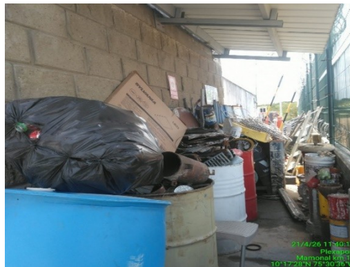
Figura 5. Centro de acopio RESPEL.

PLEXAPORT S.A.S., genera residuos peligrosos durante las actividades de mantenimiento, los cuales son almacenados temporalmente en contenedores metálicos ubicados en un área con poco espacio, la cual está señalizada, techada, y cuenta con dique de contención; estos residuos son recolectados y transportados de acuerdo a la necesidad por Servicios Industriales y Asesorías Ambientales S.A.S. SEIAMB S.A.S., identificado con NIT 900871515, quien cuenta con la RESOLUCION No. EPA-RES-00220-2025 DE lunes, 12 de mayo de 2025 “POR MEDIO DE LA CUAL SE DA CUMPLIMIENTO A LA OBLIGACION DE ENTREGA DE UN PLAN DE CONTINGENCIA DE LA EMPRESA SEIAMB S.A.S Y SE DICTAN OTRAS DISPOSICIONES” y estos mismos entregan a BIOGER S.A.S. E.S.P., identificado con NIT 806006669-8 para su disposición final.