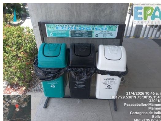
Figura 4. Punto ecológico

PLEXAPORT S.A.S., cuenta con puntos ecológicos, los cuales están distribuidos en zonas estratégicas para la correcta segregación en la fuente, cumpliendo con la normativa aplicable. Los residuos ordinarios son gestionados con una frecuencia de recolección de 3 veces a la semana por la empresa Veolia Servicios Industriales Colombia S.A.S E.S.P., identificada con NIT 805001538-5.