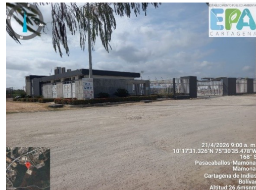
Figura 2. Fachada principal de PLEXAPORT S.A.S.

La actividad económica de PLEXAPORT S.A.S., está enmarcada en el código CIU 4661 “Comercio al por mayor de combustibles sólidos, líquidos, gaseosos y productos conexos”.