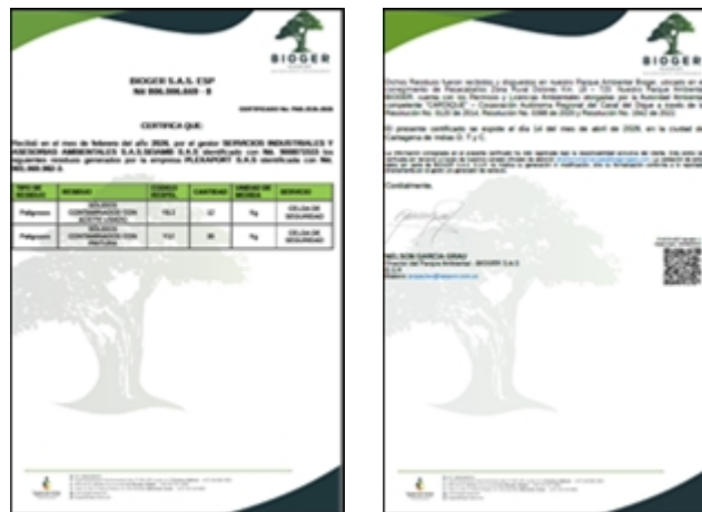
Figura 6. Certificado de disposición RESPEL