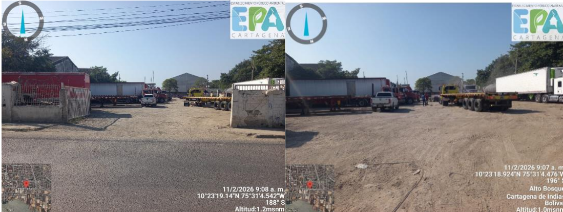
Figura 5 y 6. Parqueadero TRTANS LOGISTICA SAJAKE.