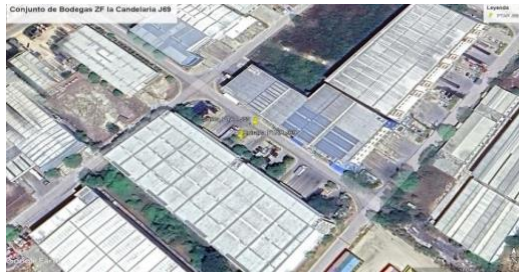
Imagen 1. Localización geográfica de Portonaito S.A.S

Asimismo, cabe destacar que Inversiones Portonaito S.A.S. cuenta con permiso de vertimiento vigente para la descarga de sus aguas residuales domésticas tratadas, las cuales son conducidas hacia la red de recolección interna de aguas residuales de la Zona Franca La Candelaria, con disposición final en el Canal Casimiro, conforme a lo establecido en la Resolución EPA-RES-00446-2023 del 26 de octubre de 2023.