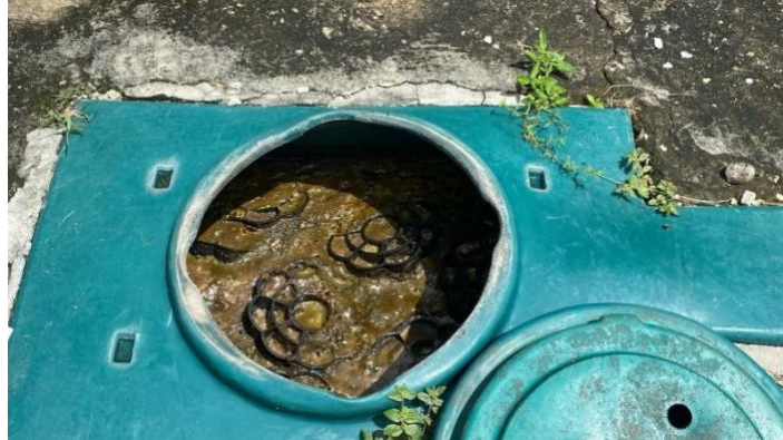
Primer tanque séptico, PTAR PORTONAITO SAS

cuarto, un flujo mayor al previsto o un diseño subdimensionado provoca que las ARD pasen muy rápido por el tanque, impidiendo la adecuada sedimentación y digestión de los sólidos.