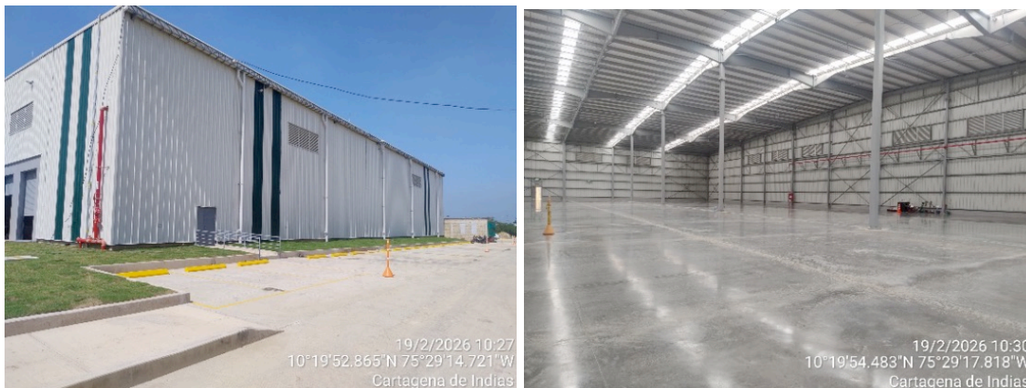
Figura 2. Bodegas Finalizadas.

Al momento de la visita el proyecto ya había finalizado y se encontraban realizando actividades de limpieza de bodegas para entrega a cliente final, por tanto, su porcentaje de avance completa un 100% .